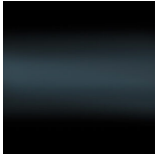
Nero lucido (RAL 9005)